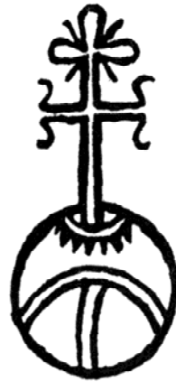
Kleines Druckerzeichen der Michaelisbrüder zu Klostercr, 1481, rot gedruckt