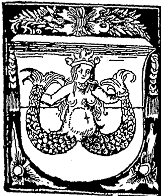
Druckerzeichen des Dr. Nicolaus Marschall (Thurius) 1521

Impressum Rhostochii, in ædibus Thuriis, a uiro solletti, Gun- tero, cognomento Hyeme, Erphordiano, Anno M. D. XXI ad nonas Iulias