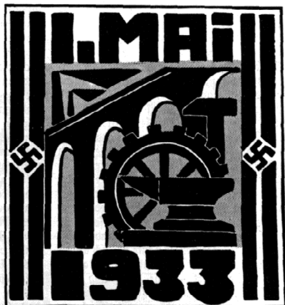
Plakatentwurf zum 1. Mai (Oberrealschüler)

Wie aber, wenn wir plötzlich eine Mappe fänden, deren Inhalt von der Hand der Kinder niedergeschriebene Geschichte aus der großen Zeit vor hundert Jahren ent- hielte? Wäre das nicht eine Fundgrube eigener Art, die unser Interesse verdiente? Denken wir darum aus der Gegenwart heraus geschichtlich und lassen wir unsere Jugend Bericht geben von der Vaterlands- liebe und dem Schwung in uns allen!